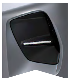
PRE SIVÚ MERCURY