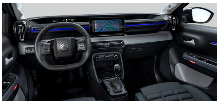
INTERIÉR URBAN GREY (NBFX)