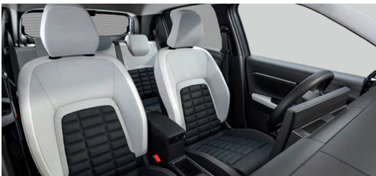
Látkový poťah čierny Fabric / sivý TEP poťah Sedadlá Citroën Advanced Comfort Palubná doska a panely dverí s dekórom Siderite