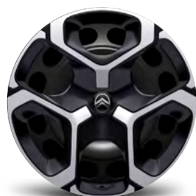
OKRASNÝ KRYT AZURITE 17"