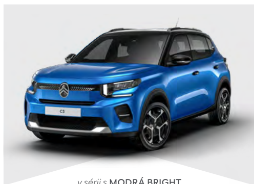
v sérii s MODRÁ BRIGHT