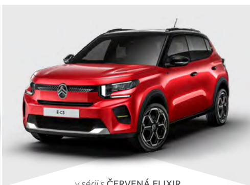
v sérii s ČERVENÁ ELIXIR