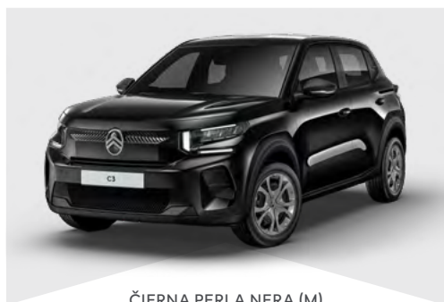
ČIERNÁ PERLA NERA (M)