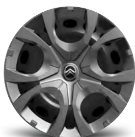
OKRASNÝ KRYT PYRITAE 16"