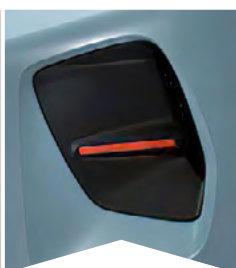
PRE MODRÚ MONTE CARLO