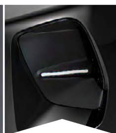
PRE ČIERNU PERLA NERA