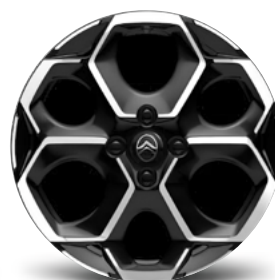
DISK Z LAHKEJ ZLIATINY ATACAMITE 17"