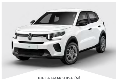
BIELA BANQUISE (N)