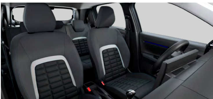
Látkový poťah čierny Fabric / tmavo sivý Asphalt Sedadlá Citroën Advanced Comfort Palubná doska a panely dverí s modrým dekórom