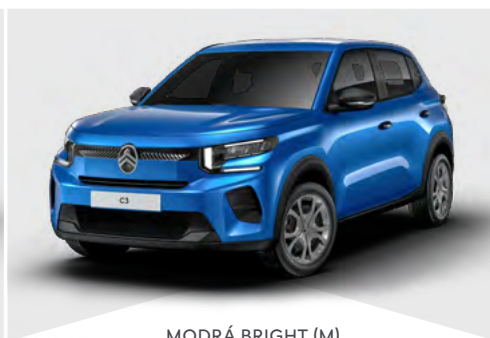
MODRÁ BRIGHT (M)

(M) – metalická farba karosérie, (N) – nemetalická farba