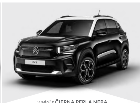
v sérii s ČIERNÁ PERLA NERA

Je možné zvoliť aj jednofarebnú karosériu (okrem modrá MONTE CARLO a MODRÁ BRIGHT).