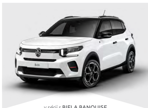
v sérii s BIELA BANQUISE