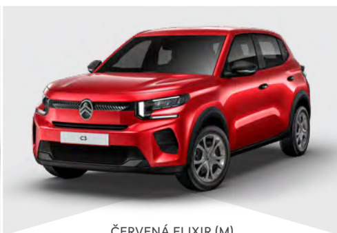
ČERVENÁ ELIXIR (M)