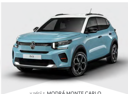
v sérii s MODRÁ MONTE CARLO