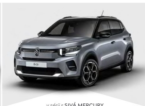
v sérii s SIVÁ MERCURY