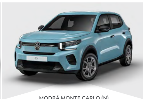
MODRÁ MONTE CARLO (N)