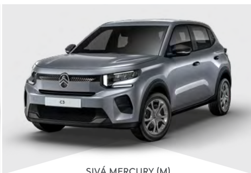
SIVÁ MERCURY (M)